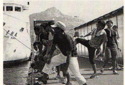
弓削商船との練習試合にて